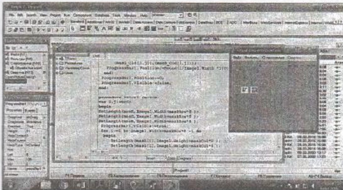
Рис.2. Фрагмент программы на Delphi 7.0 обработки изображения

Используем матрицы маски для реализации различных алгоритмов обработки изображений. Мы разработали программное обеспечение обработки изображения, которое представлено на рис.2.