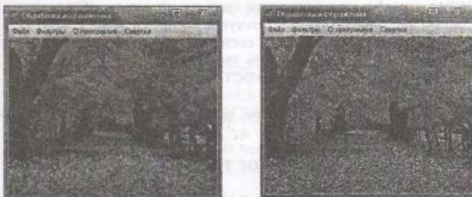
Рис.3. Программа обработки изображения. До и после обработки.

В коде программ реализованы методы обработки изображения, описанные выше. Результат работы программы представлен на рис.3.